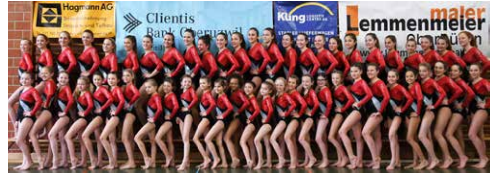
Die Turnerinnen vom Getu Uzwil.

grafik | logos | visitenkarten | flyer | webdesign | werbung fabrikstrasse | uzwil | infos unter www.gmuersdesign.ch